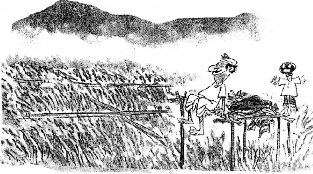
SEZ : நிலத்திற்குப் பதில் வேலைவாய்ப்பு- அரசு