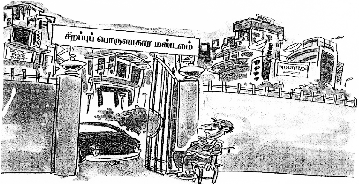
ஆனால் இது தான் - உண்மை நிலை