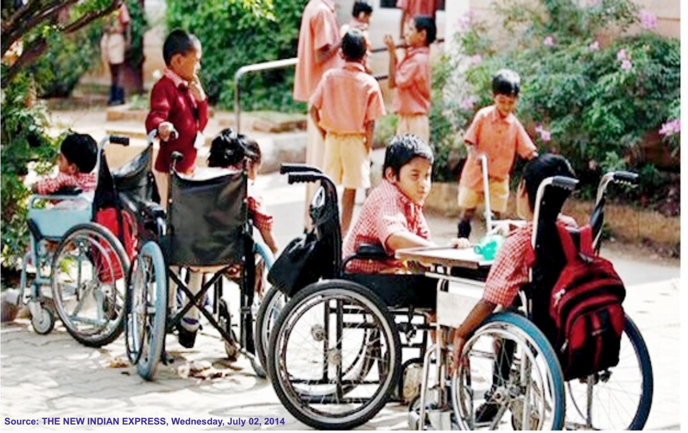
Source: THE NEW INDIAN EXPRESS, Wednesday, July 02, 2014

ஆவணங்களிலும், ஊடகங்களிலும் “அனைவரையும் உள்ளடக்கிய கல்வி” என்ற சொல்லால் விரைவாக சேர்க்கப்பட்டது.